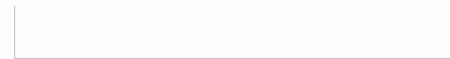
全市普通国省干线公路交通流量统计表(单位:辆/日)