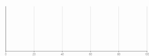
月度全市普通国省干线交通流量排名